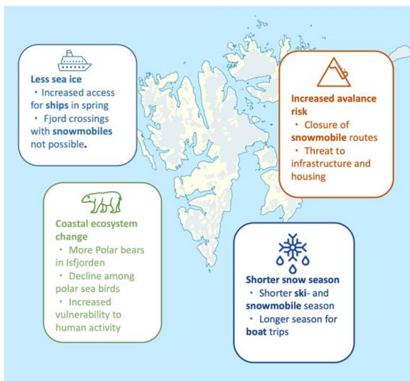
FIGUR 1. SAMMENFATNING AV KLIMAENDRINGER MED KONSEKVENSER FOR REISELIVET PÅ SVALBARD. DANNEVIG MFL. 2023

Samtidig viser forskning 1 at reiselivet i Longyearbyen har høy tilpasningsevne og ikke ser på de projiserte endringene som kritisk for sin virksomhet.